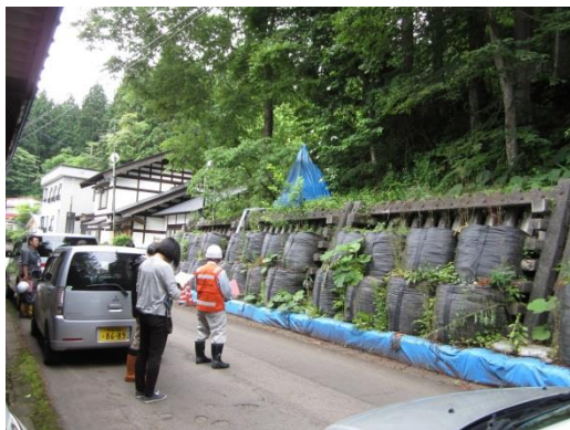
北秋田市 阿仁前田神成（地すべり）