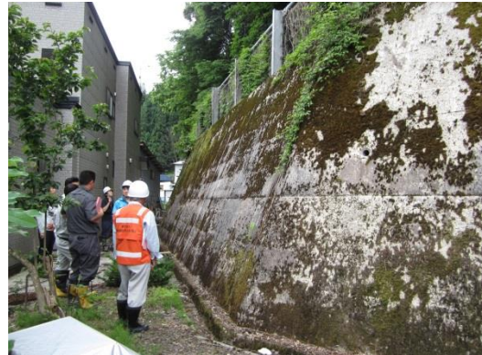
北秋田市阿仁前田桂坂（急傾斜地）