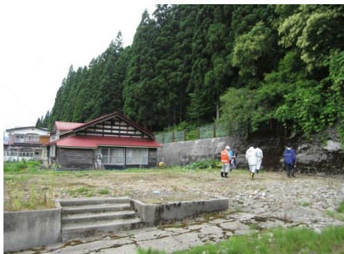
上小阿仁村 長信田地区（急傾斜地）