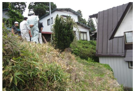
大館市 愛宕地区（急傾斜地）