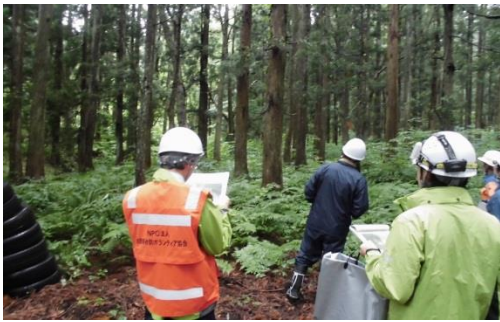
大仙市 大曲西根鳥居沢地区（土石流）