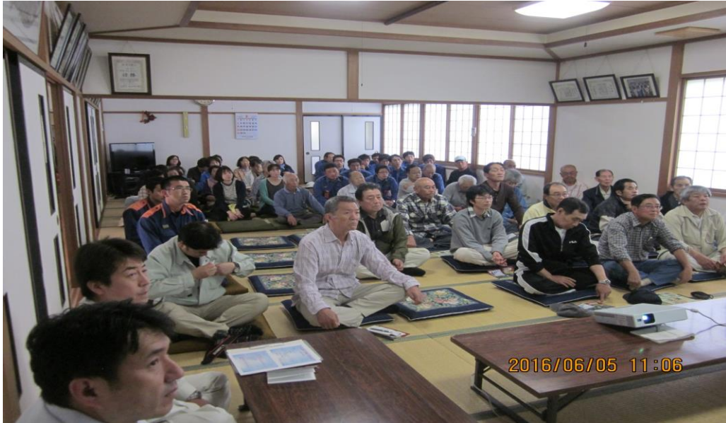
避難訓練における学習会 にかほ市象潟町川袋自治会センター