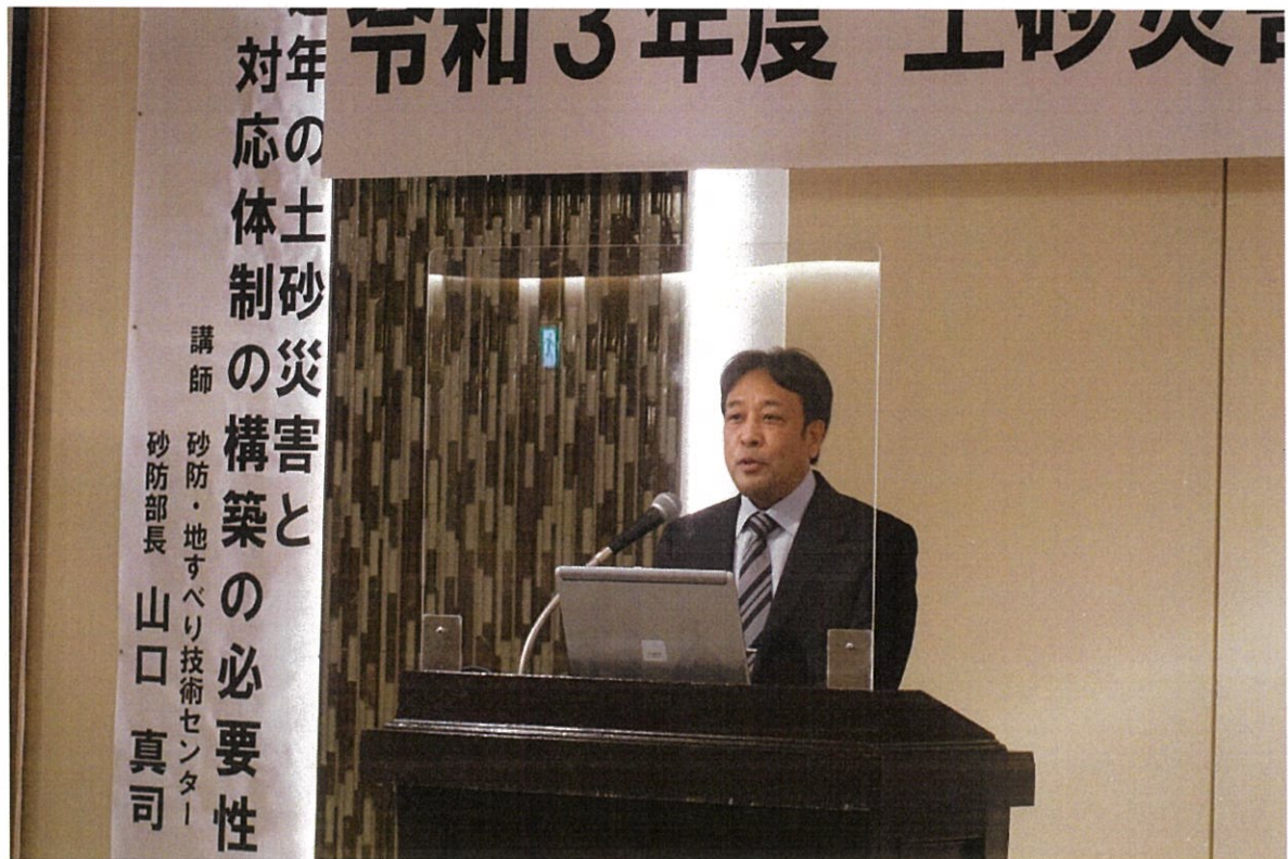
木次谷英成流域防災監