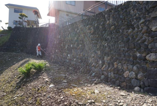
既存施設の状況確認