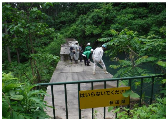
大仙市 6月22日(木) 内沢沢地区