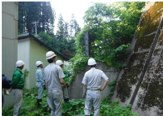
◇仙北地域振興局管内の点検状況 仙北市 6月20日(火) 岩瀬1号地区