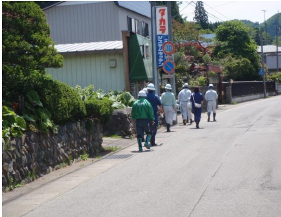
大館市 6月27日(火) 独沢 地区