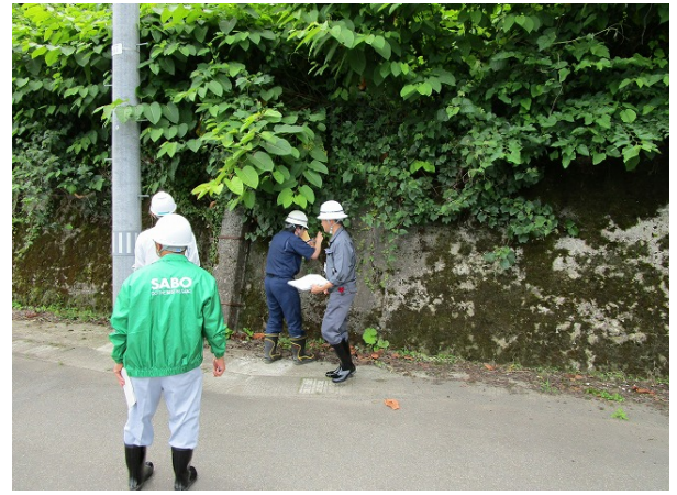
◇ 仙北地域振興局管内の点検状況