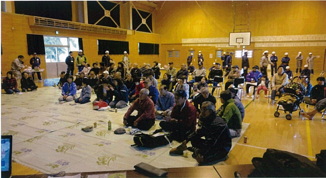
避難訓練における学習会 湯沢市雄勝地域下院内地区(旧院内小学校体育館)