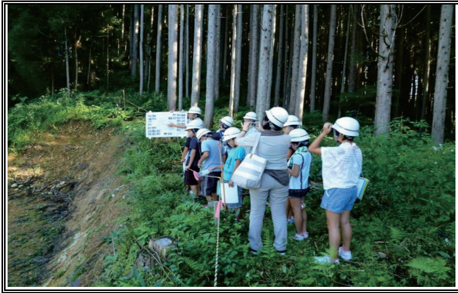
上小阿仁小学校河川砂防学習会(中五反沢)